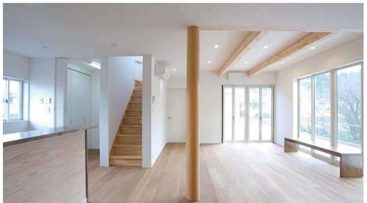
珪藻土壁に囲まれた健康的な癒し空間を演出。 大黒柱が印象的となりました。

世代によるライフスタイルに合う家創りをテーマとしました。形もイメージカラーも違う2つの建物を構成して渡廊下でつなぐようにしました。1軒の家ではなく2軒の家がそれぞれの個性を持ちながらまわりの町並みにマッチしています。