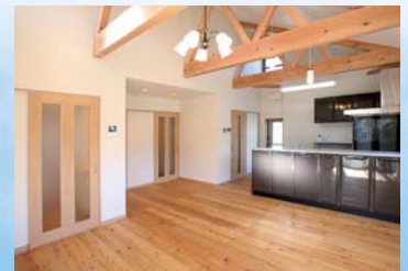
天井が高く開放的な 木造り空間を実現。